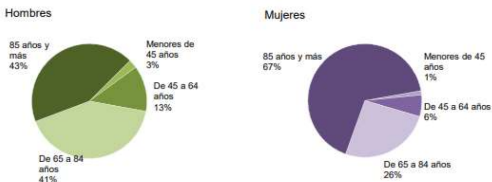
GRÁFICO 3: TASA DE MORTALIDAD POR EDADES EN ARAGÓN

Siguiendo los datos recogidos en el informe publicado por el IAEST en el 2024, acerca del número de muertes registradas en Aragón en el 2022, se puede apreciar como mueren con una edad más longeva las mujeres aragonesas que los hombres. Por otro lado, en 2022 la esperanza de vida en Aragón de las mujeres fue de 85,1 años, mayor que la de los hombres que fue de 78,7 años. Comparado con España los datos de esperanza de vida en 2022 fueron, de 83,9 años para las mujeres y de 77,5 años para los hombres. Este dato evidencia que los aragoneses fallecen con un porcentaje algo mayor que en España. Las mujeres tienen mayor esperanza de vida tanto en Aragón como en España, fallecen más tarde que los hombres (IAEST, 2024).